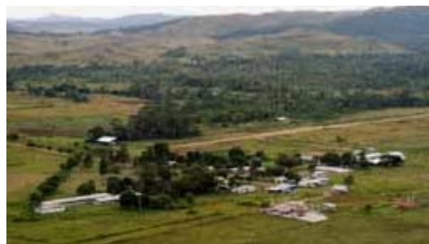
Die Schule Colegio Gran Sabana in Venezuela

Carsten: Ich denke, dass durch mein persönliches