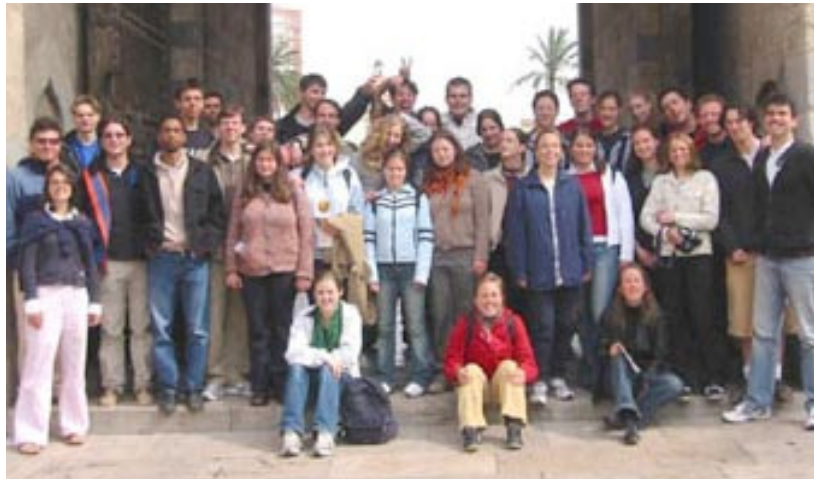
Die Bogenhofener Evangelisten

Bei den verschiedenen Straßenaktionen hatte jeder die Möglichkeit, sich gemäß seiner Fähigkeiten einzubringen. Es war faszinierend mitzuerleben, mit wie viel Begeisterung die Jugendlichen von Jesus erzählt haben. Noch erstaunlicher war die positive Resonanz der Studenten auf der Straße. Die Frucht dieser Evangelisation waren 30 Gäste, von denen sieben bereits Bibelstunden erhalten. Die Gemeinden vor Ort waren so enthusiastisch, dass sie uns gebeten