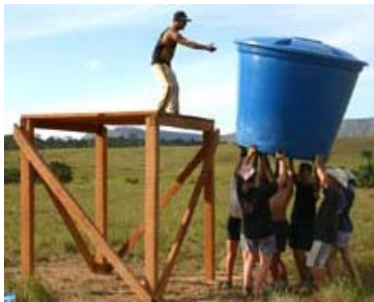
Ein Wassertank garantiert den dort lebenden Menschen den ständigen Zugang zu Trinkwasser und hilft somit auch gegen Krankheiten vorzubeugen.

Am Sonntag ging es dann um 6 Uhr Früh los zu unserem Einsatzort in das zwei Stunden entfernte Chirikayen, ein Dorf mit ca. 300 Einwohnern. Da die meisten Familien sehr kinderreich sind, gibt es dort allerdings nicht viele Unterkünfte. Die Mädchen heiraten meist schon im Alter von 14 oder 15 Jahren