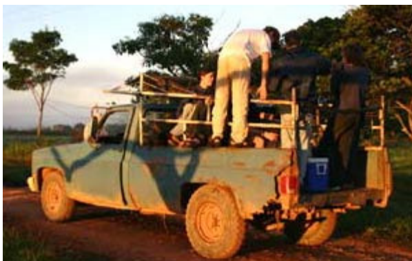
Zu zwölf mussten wir samt Gepäck auf der Ladefläche dieses Jeeps Platz finden, der uns dann von Maurak in „unser“ Dorf brachte.