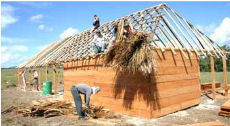
Während einige an den Wänden des Hauses arbeiteten, begann der zweite Teil der Gruppe schon mit dem aufwändigen Dach.

wir durch Musikbeiträge mitgestalteten, beeindruckte uns durch sein einfaches, aber doch eindrucksvolles Programm. Die Herzlichkeit und Wärme, die von den Menschen ausgingen, sind bis zum heutigen Tag in unseren Herzen geblieben. Am Nachmittag stand „Abkühlung im Fluss“ auf dem Programm, doch der Regen, der von oben für Abkühlung sorgte, machte uns einen Strich durch die Rechnung. Aber auch damit war der Tag noch lange nicht zu Ende, denn schließlich durften wir am Abend für