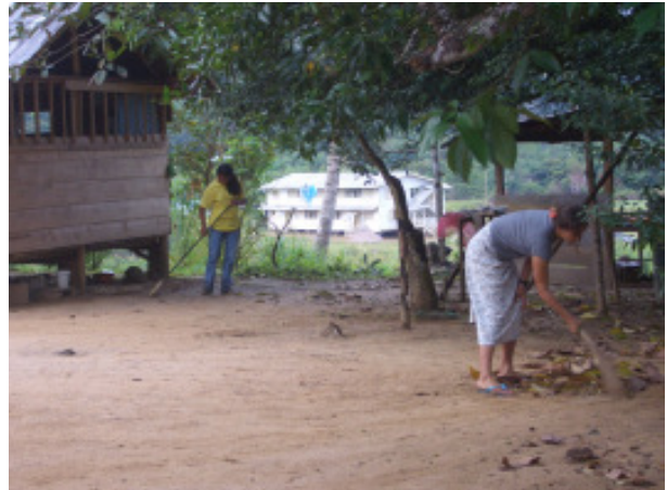
Schüler bei ihrem freiwilligen Dienst im Dorf

Jeden Sonntagmorgen um 5:45 stand ein besonderer Programmpunkt auf unserer Agenda: Community Service. Ein Dienst, um den Dorfbewohnern zu helfen, die Hilfe brauchten, z.B. die Alten oder Kranken. Unter der Woche ging ich ins Dorf um herauszufinden, wo Hilfe gebraucht wurde. Am Sonntag arbeiteten alle Studenten & Lehrer zusammen, um anderen zu helfen. Da wurde dann Feuerholz gespalten, Straßen gesäubert, Müll aufgehoben, gejätet und Wasser geholt. Es beeindruckte mich, wie Studenten freiwillig für andere arbeiteten, ohne einen Vorteil für sich selbst daraus zu ziehen. Die Dorfbewohner, welche Hilfe brauchten, waren sehr dankbar, besonders die alten Frauen, die alleine lebten und Schwierigkeiten hatten, sich selbst zu versorgen.