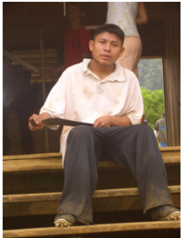
Vorbereitung der Werkzeuge für den Arbeitsnachmittag