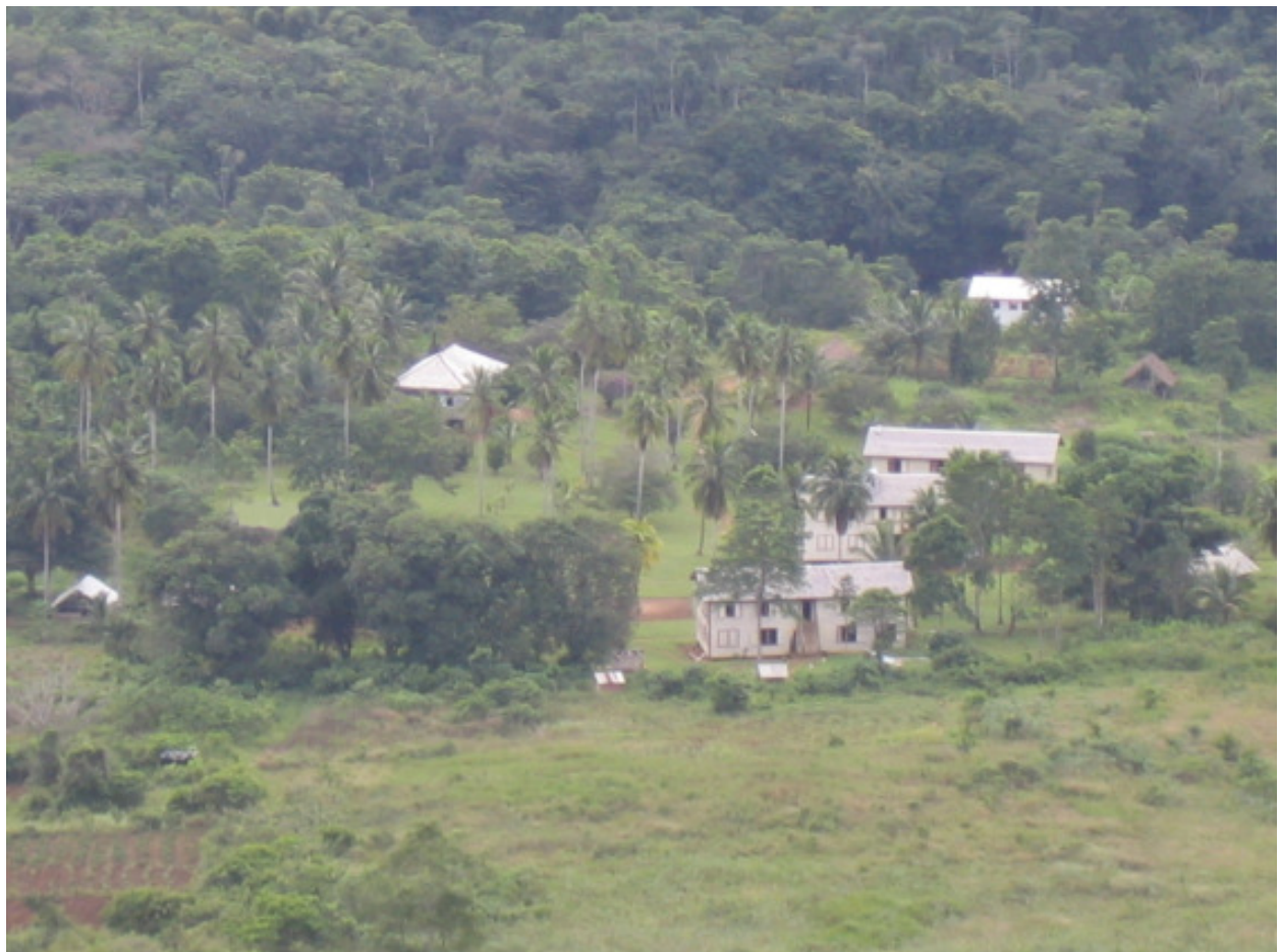
DIIC - Davis Indian Industrial College