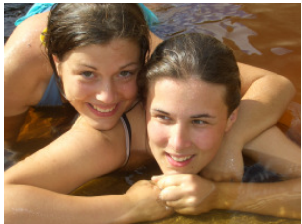
Wäsche waschen und baden am Fluss