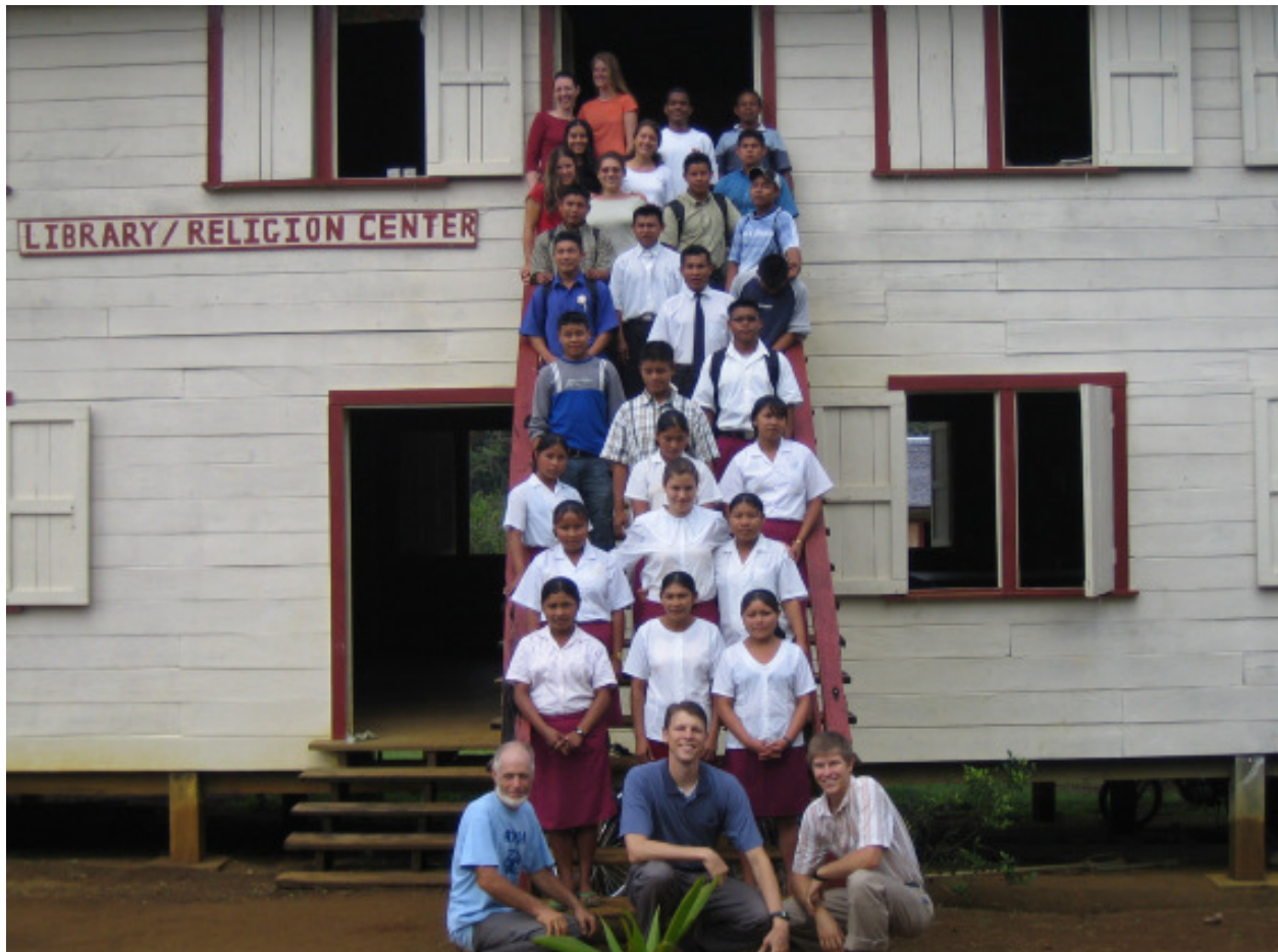
Schüler, Studentenmissionare und Missionare