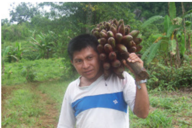
Bananen die nach Melone schmecken