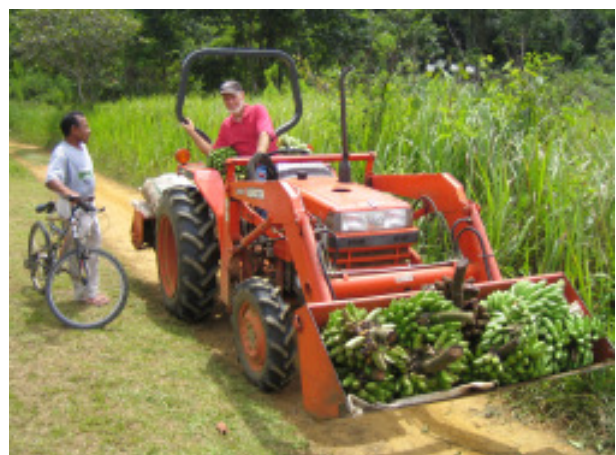
Der Zehnte wird zur Adventgemeinde gebracht