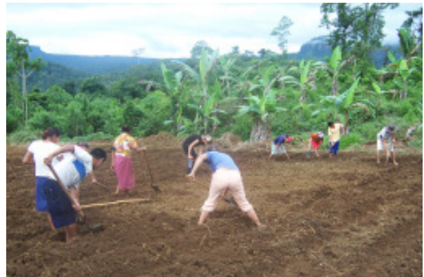
Schüler bei der täglichen Arbeit auf der Farm