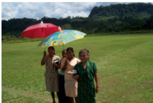
Schüler auf dem Weg zur Gemeinde