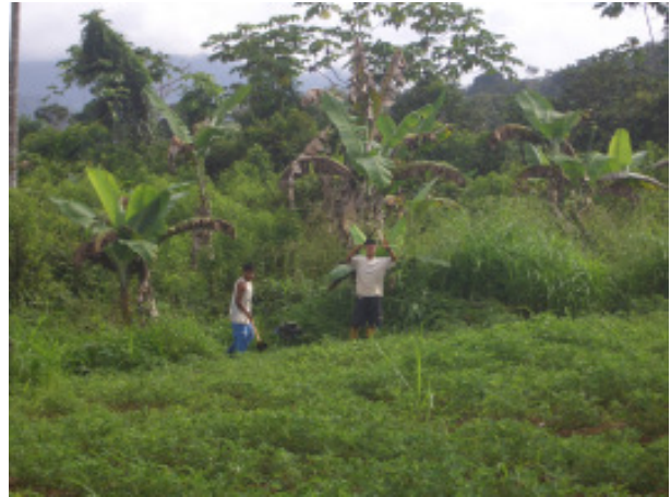
Schüler bei der Arbeit ...

Nach dem Frühstück gingen wir alle zusammen auf die Farm und arbeiteten dort für 3 Stunden. Wir jäteten Unkraut und ernteten das, was an diesem Tag in der Küche verwendet werden würde. Nach unserer Feldarbeit lief unsere kleine Dusche auf Hochtouren und die geduldig Wartenden nutzen die letzten Minuten für noch-nicht-vollendete Hausaufgaben.